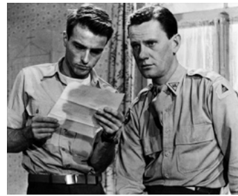
1948 LES ANGES MARQUÉS (The Search) de Fred Zinneman avec Montgomery Clift