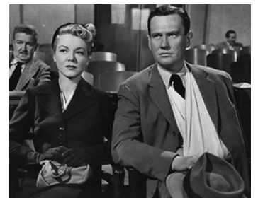
1952 LA FEMME SANS LOI (My Man and I) de William Wellman avec Claire Trevor