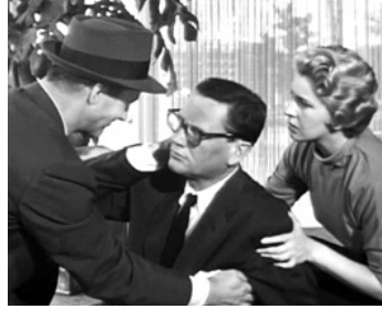
1955 LE TUEUR S'EST ÉVADÉ (The Killer is loose) de B. Boetticher avec J. Cotten, R. Fleming