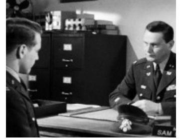
1956 SUPPLICE DES AVEUX (The Rack) d'Arnold Laven avec Paul Newman