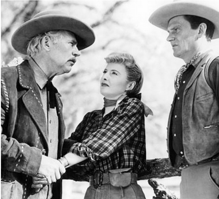
1950 LES FURIES (The Furies) d'Anthony Mann avec Walter Huston, Barbara Stanwyck