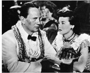
1953 LES BAS-FONDS D'HAWAII (Hell's half acre) de John H. Auer avec Evelyn Keyes