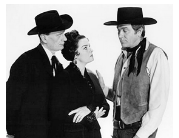
1966 LA LOI DES HORS-LA-LOI (Waco) de R.G. Springsteen avec Jane Russell, Cameron Mitchell