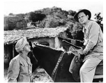
1948 LE MANGEUR D'HOMMES (Man Eater of Kumaon) de Byron Haskin avec Sabu