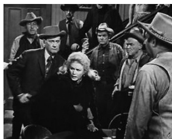
1966 FORT BASTION NE RÉPOND PLUS (Red Tomahawk) de R.G. Springsteen avec Joan Caulfield