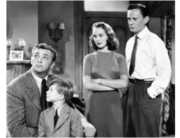
1949 MARIAGE COMPLIQUÉ (Holiday Affair) de Don Hartman avec R. Mitchum, Janet Leigh