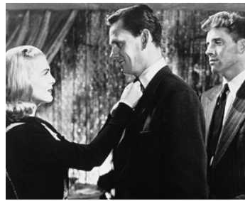
1947 L'HOMME AUX ABOIS (I walk alone) de Byron Haskin avec L. Scott, B. Lancaster