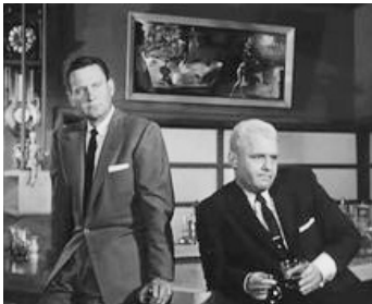
1954 LE GRAND COUTEAU (The Big Knife) de Robert Aldrich avec Rod Steiger