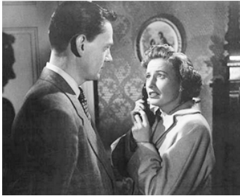
1948 RACCROCHEZ, C'EST UNE ERREUR (Sorry wrong number) d'A. Litvak avec B. Stanwyck