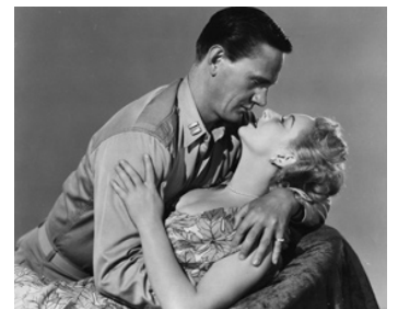
1951 TONNERRE SUR LE PACIFIQUE (Thunder across the Pacific) d'A. Dwan avec Vera Ralston