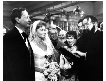
1958 NE TIREZ PAS SUR LE BANDIT (Alias Jesse James) de N. Z. McLeod avec R. Fleming, B. Hope