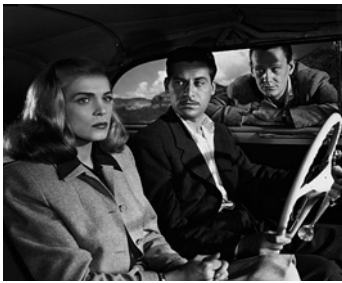
1947 LA FURIE DU DÉSERT (Desert Fury) de L. Allen avec Lizabeth Scott, John Hodiak