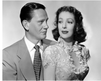
1948 MIRAGES DE LA PEUR (The Accused) avec Loretta Young