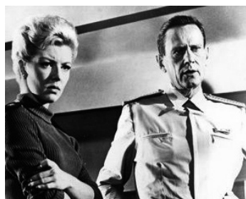
1965 WOMEN OF THE PREHISTORIC PLANET d'Arthur Pierce avec Merry Andrews