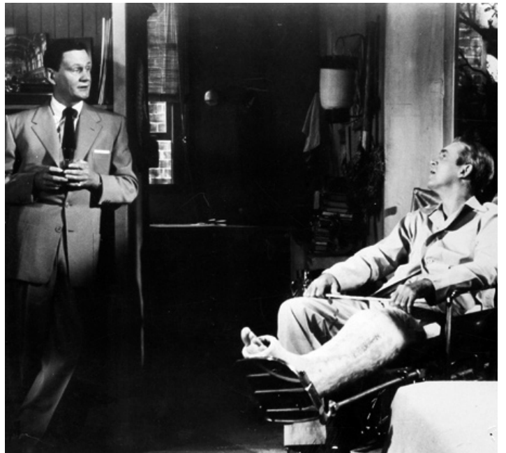
1954 FENÊTRE SUR COUR (Rear Window) d'Alfred Hitchcock avec James Stewart