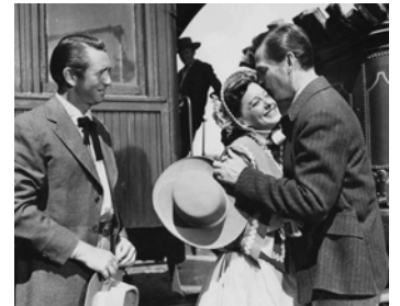
1950 LES REBELLES DU MISSOURI (The great Missouri Raid) de G. Douglas avec M. Carey, Ellen Drew