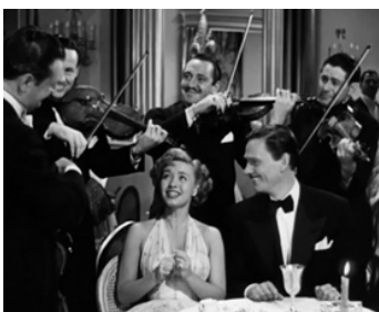
1951 RICHE, JEUNE ET JOLIE (Rich, young and pretty) de N. Taurog avec Jane Powell