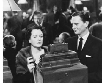
1949 FAITES VOS JEUX (Any Number can play) de Mervyn LeRoy avec Mary Astor