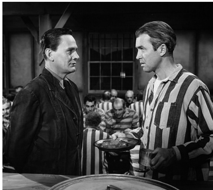
1952 L'HOMME À LA CARABINE (Carbine Williams) de Richard Thorpe avec James Stewart