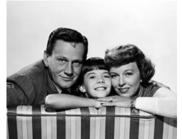
1949 LA FLAMME QUI S'ÉTEINT (No sad songs for me) de R. Maté avec N. Wood, M. Sullavan