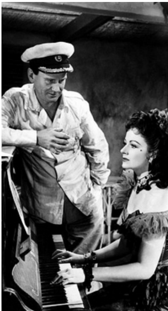
1953 LE TROPIQUE DU DÉSIR (Laughing Annie) d'Herbert Wilcox avec Margaret Lockwood