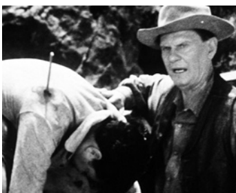
1964 MILLE DOLLARS POUR UNE WINCHESTER (Blood on the Arrow) de Sidney Salkow