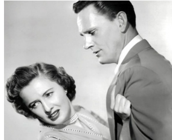
1949 LA FEMME À L'ÉCHARPE PAILLETÉE (Thelma Johnson) de R. Stodmak avec Barbara Stanwyck