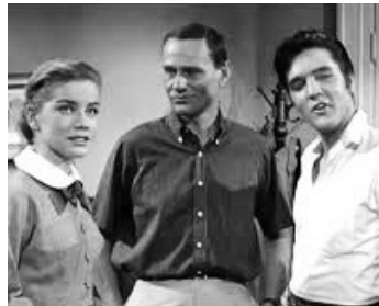
1957 AMOUR FRÉNÉTIQUE (Loving You) d'Hal Kanter avec Dolores Hart, Elvis Presley