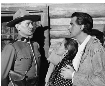
1951 AU PAYS DE LA PEUR (The wild North) d'A. Marton avec Cyd Charisse, Stewart Granger