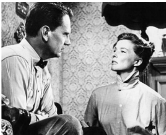
1956 LE FAISEUR DE PLUIE (The Rainmaker) de Joseph Anthony avec Katharine Hepburn