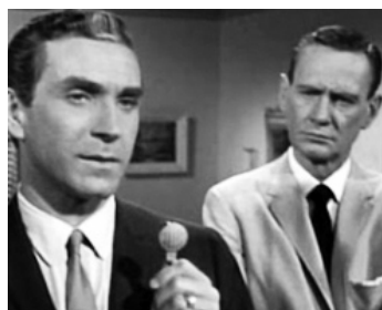
1965 LE MUR DES ESPIONS (Agents for HARM) de Gerd Oswald avec R. Montalban