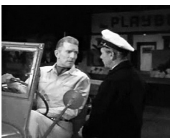
1966 CYBORG 2087 (Man from Tomorrow) de Franklin Adreon avec Michael Rennie