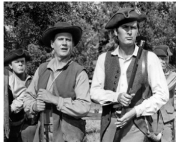
1958 LA LUEUR DANS LA FORÊT (The Light in the Forest) d'H. Daugherty avec Fess Parker