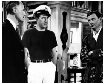
1952 LA BELLE DE LA JAMAÏQUE (Jamaica Run) de L. Foster avec Patric Knowles, Ray Milland